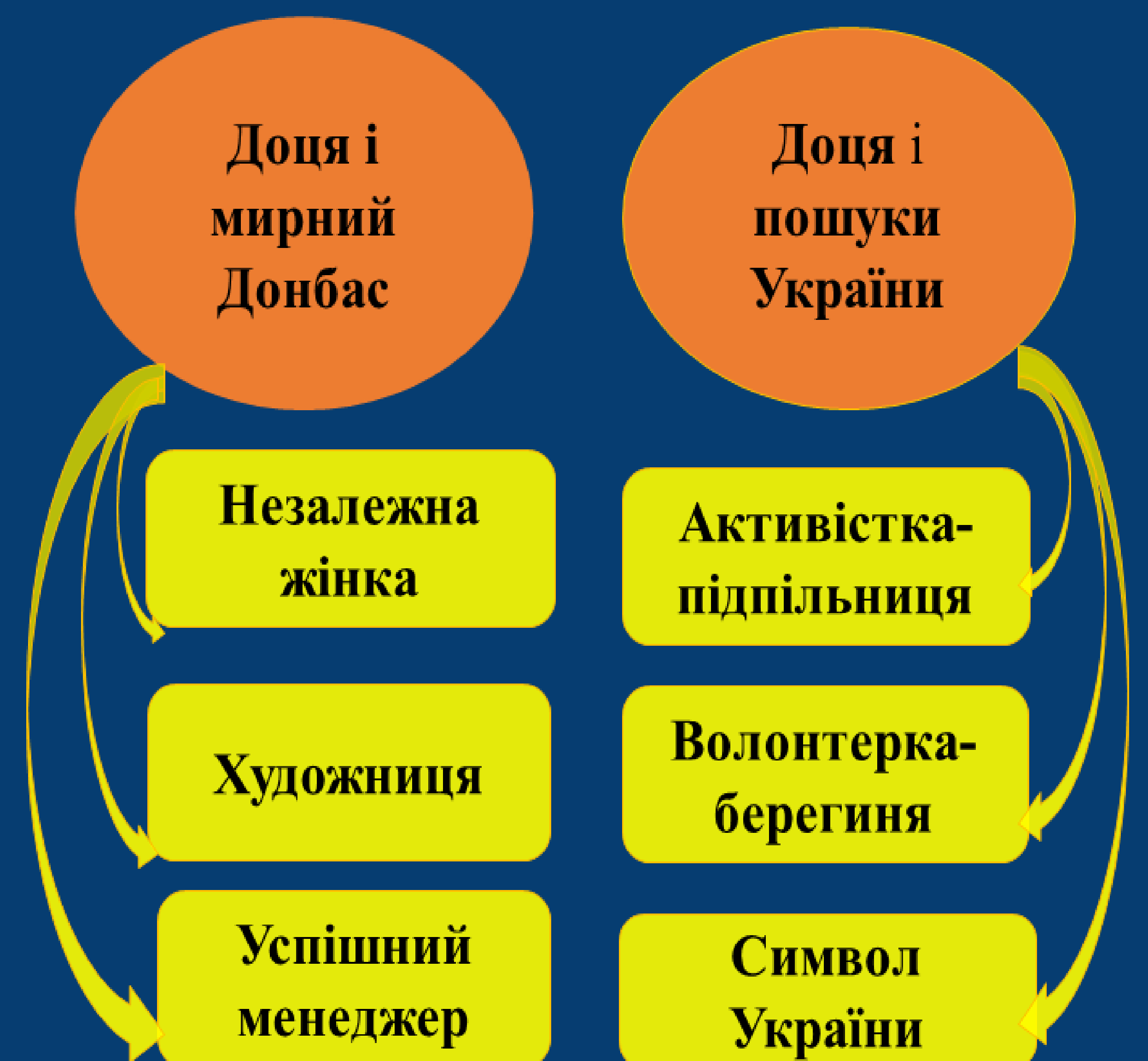
Рис.1 Образ Доці

Мета дослідження: осмислити специфіку художнього втілення теми неоголошеної війни на сході України в романі Тамари Горіха Зерня «Доця».