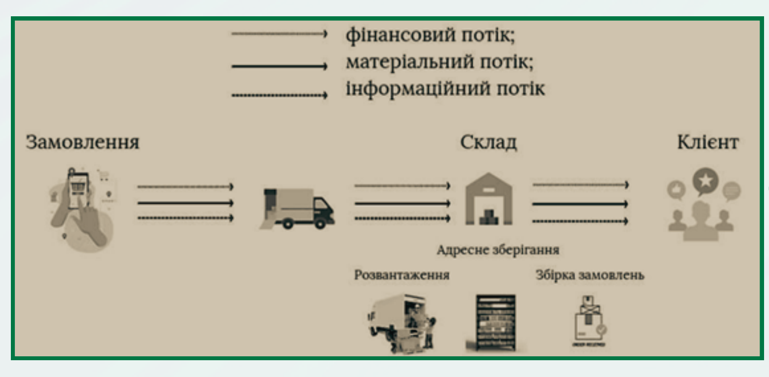
Рис.4 Ланцюг доставки ТОВ «Нова Пошта»