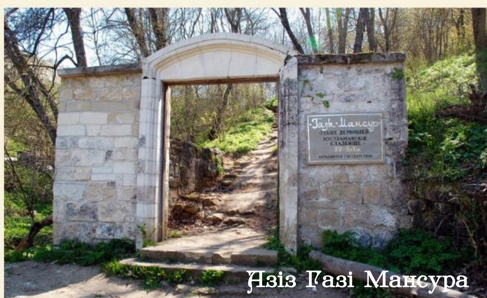
Азіз Гасі Мансура