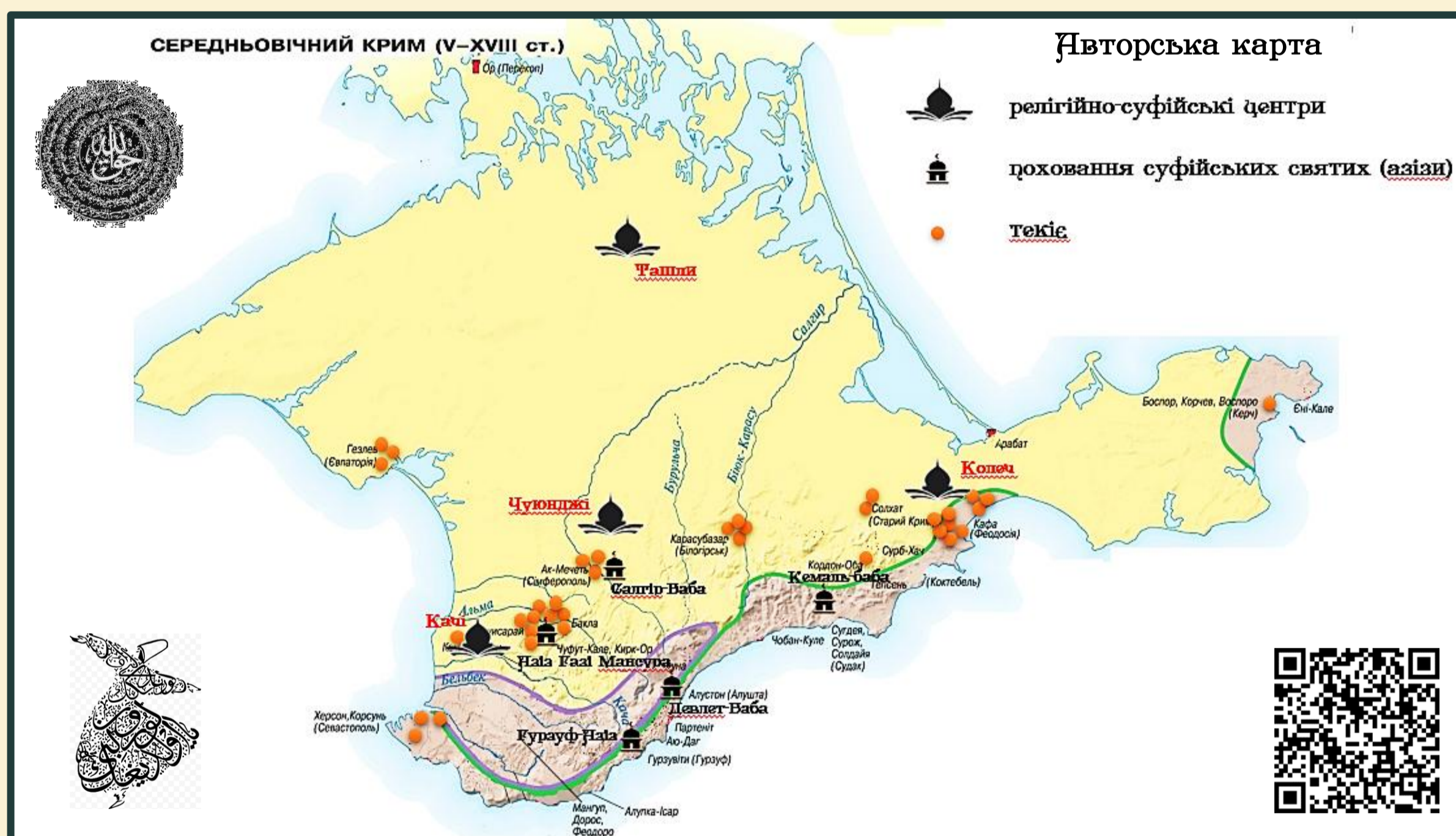
Суфійські осередки в Криму