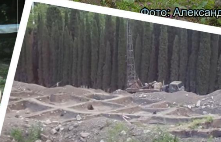
Зруйнований Турзуф Азіз