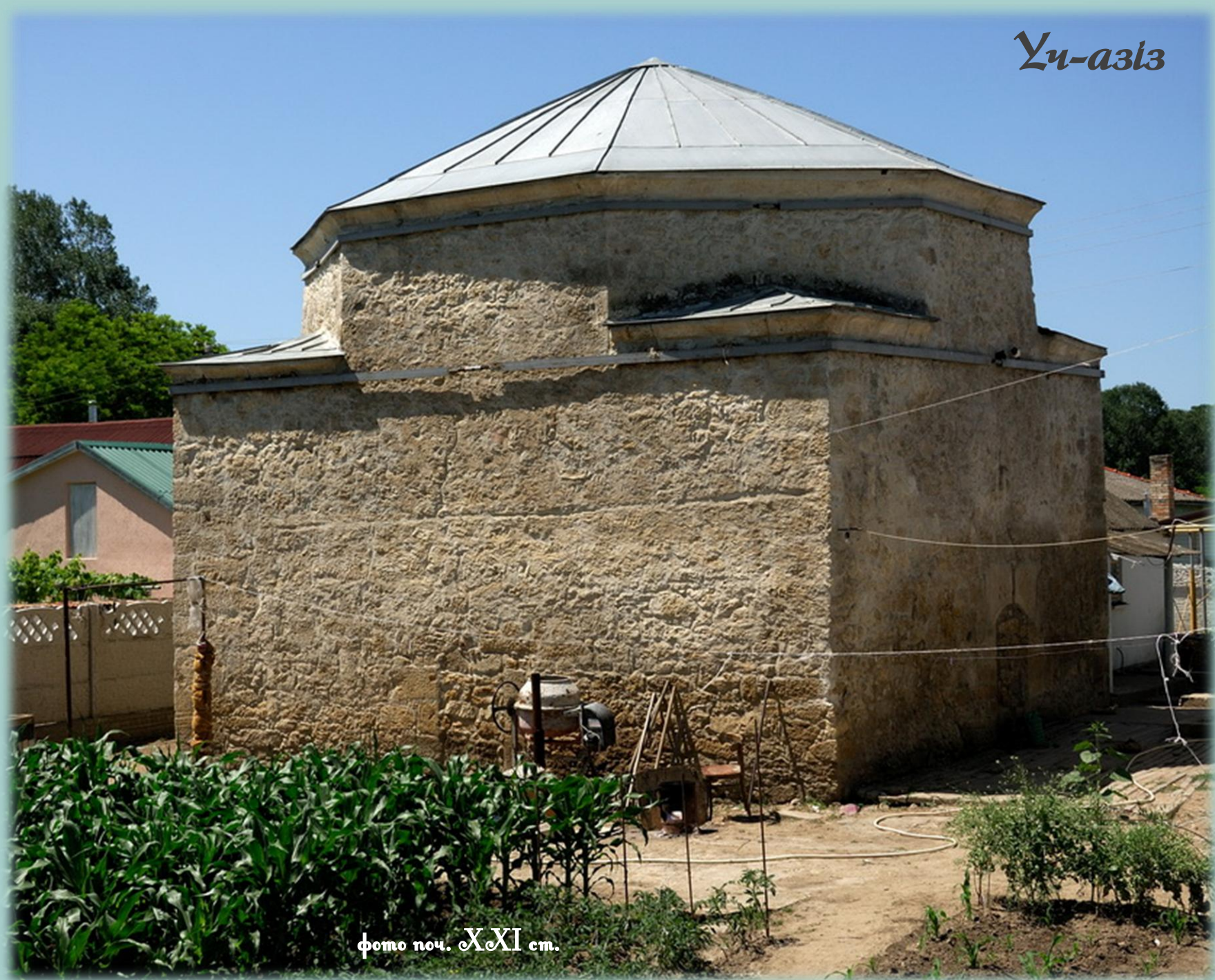
фото поч. ХХІ ст.