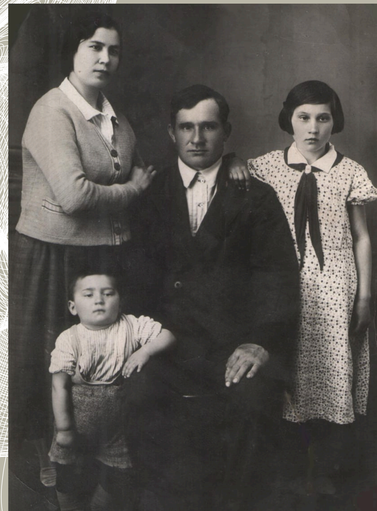
Світлина з архіву інформанта (Родинний архів)

Результати нерепрезентованого дослідження (Діаграма автора)