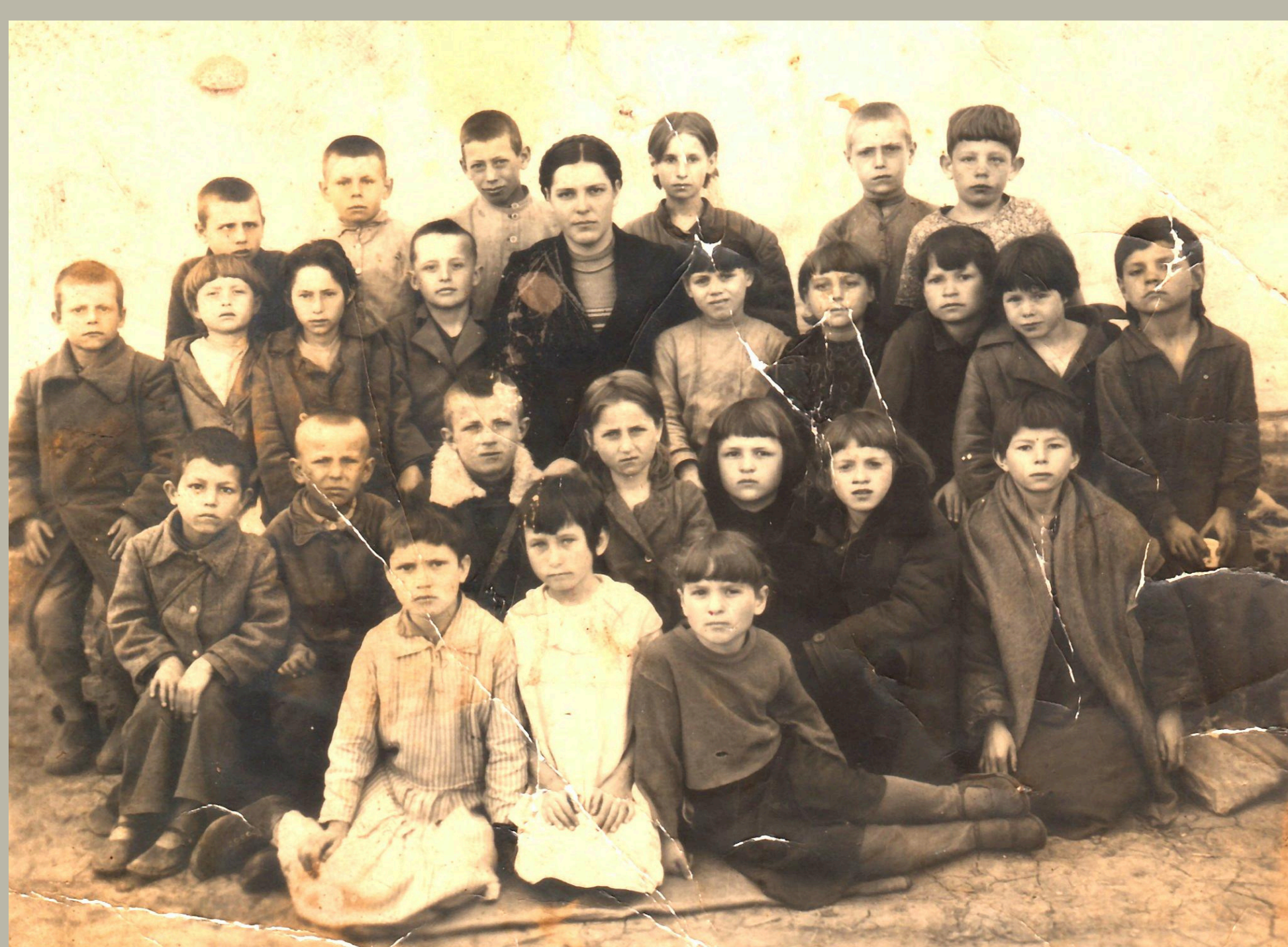
Світлина з архіву інформанта (Родинний архів)