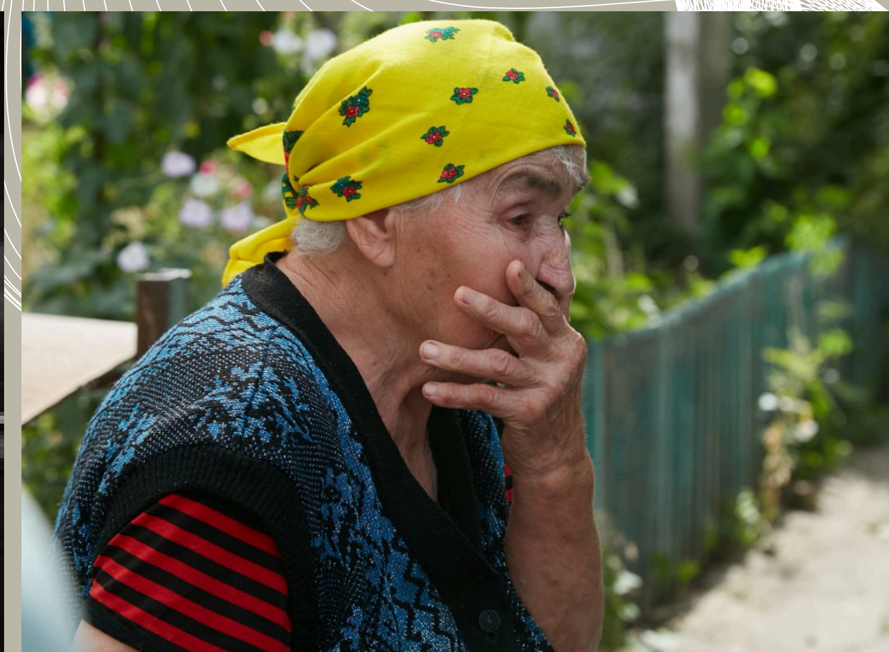
Авторська світлина з експедиції