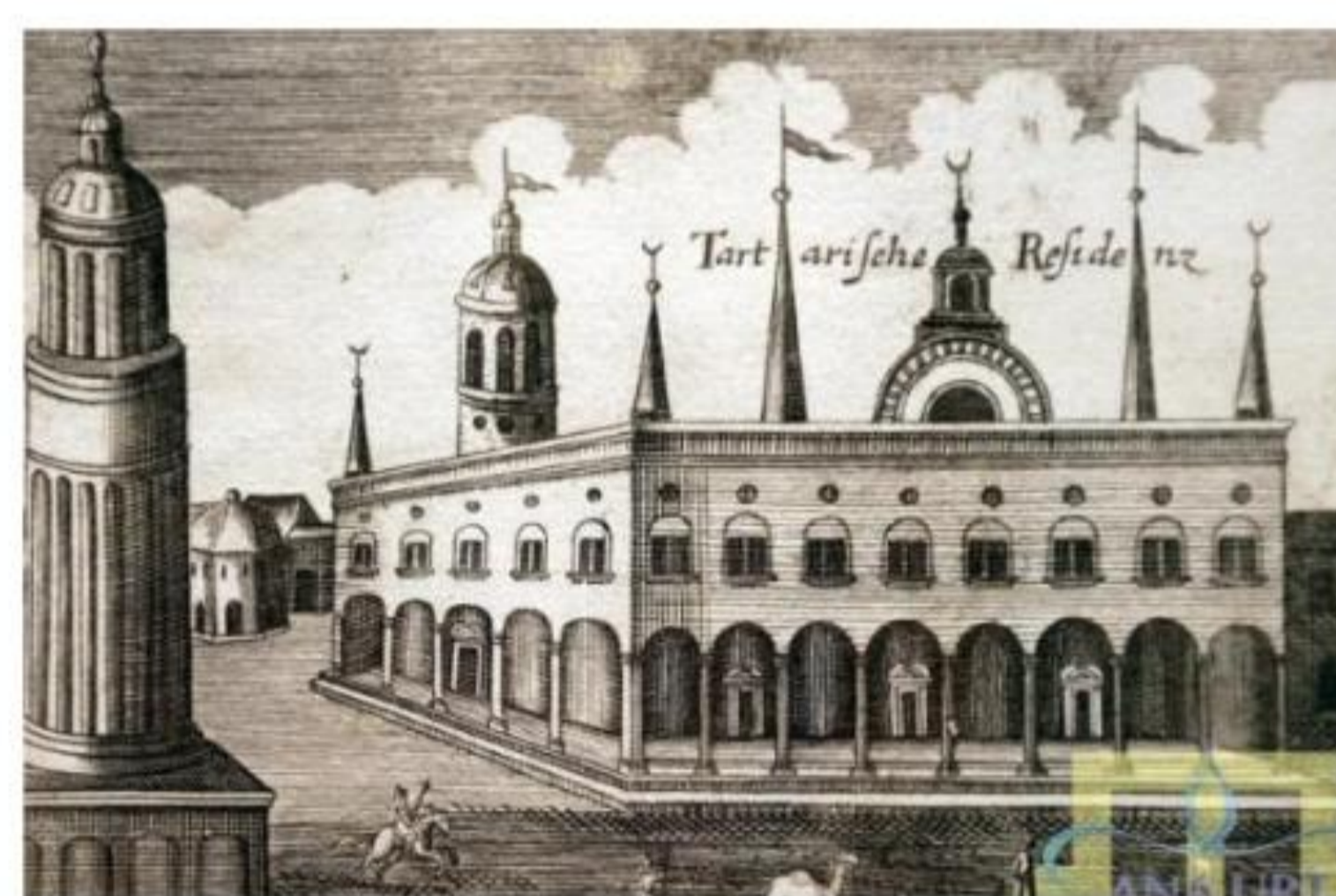
Девлет Сарай. Німецька гравюра 1687 р.