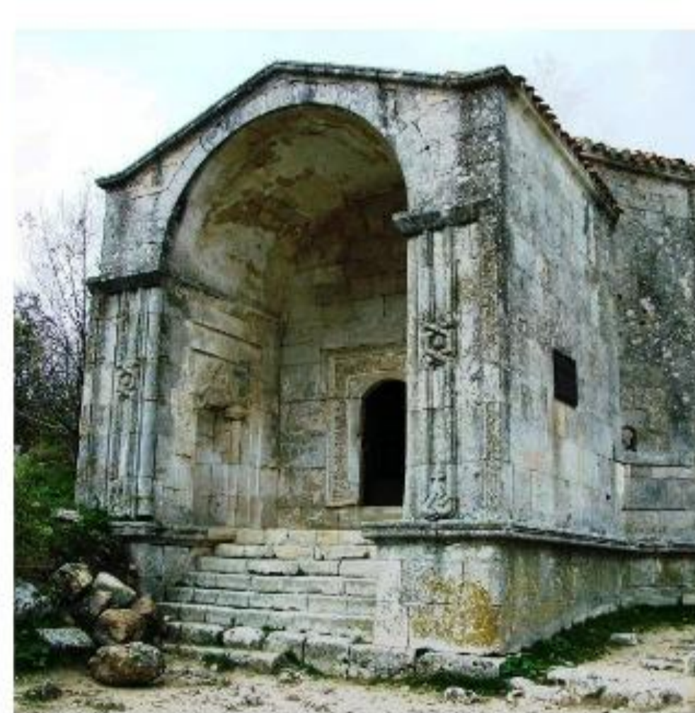
Дюрбе Джаніке Ханім 2024