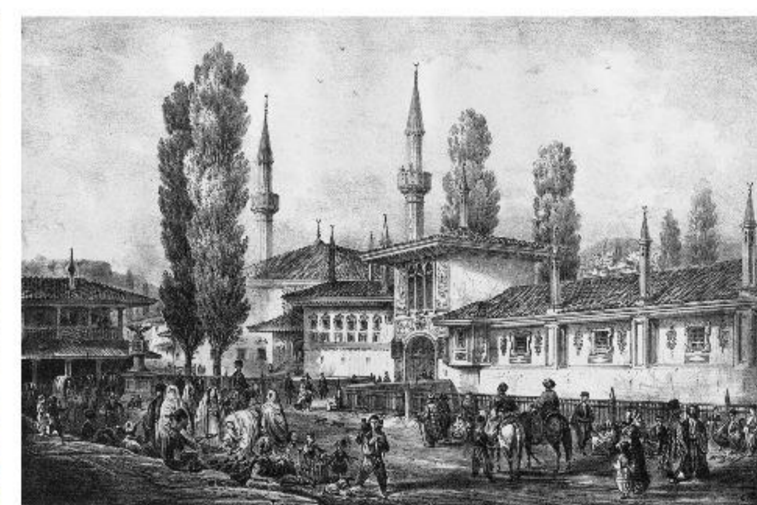
Бахчисарайський палац. Літографія I пол. XIX ст.