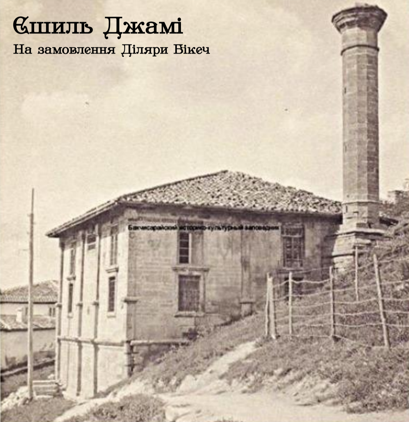
Şпил Дžамі На замовлення Діляри Бікеч