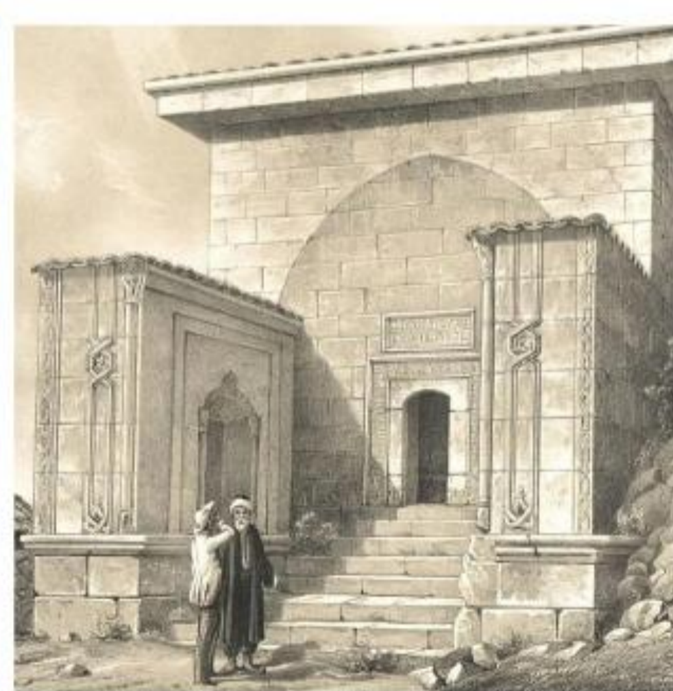
Дюрбе Джаніке Ханім мал. М. Вебеля. 1848