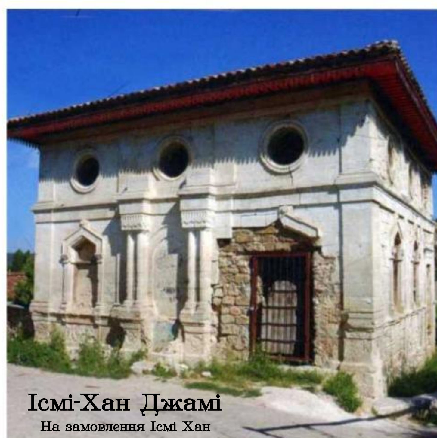
Ісмі-Хан Дžамі На замовлення Ісмі Хан

Мечеті, збудовані жінками з династії Гераїв