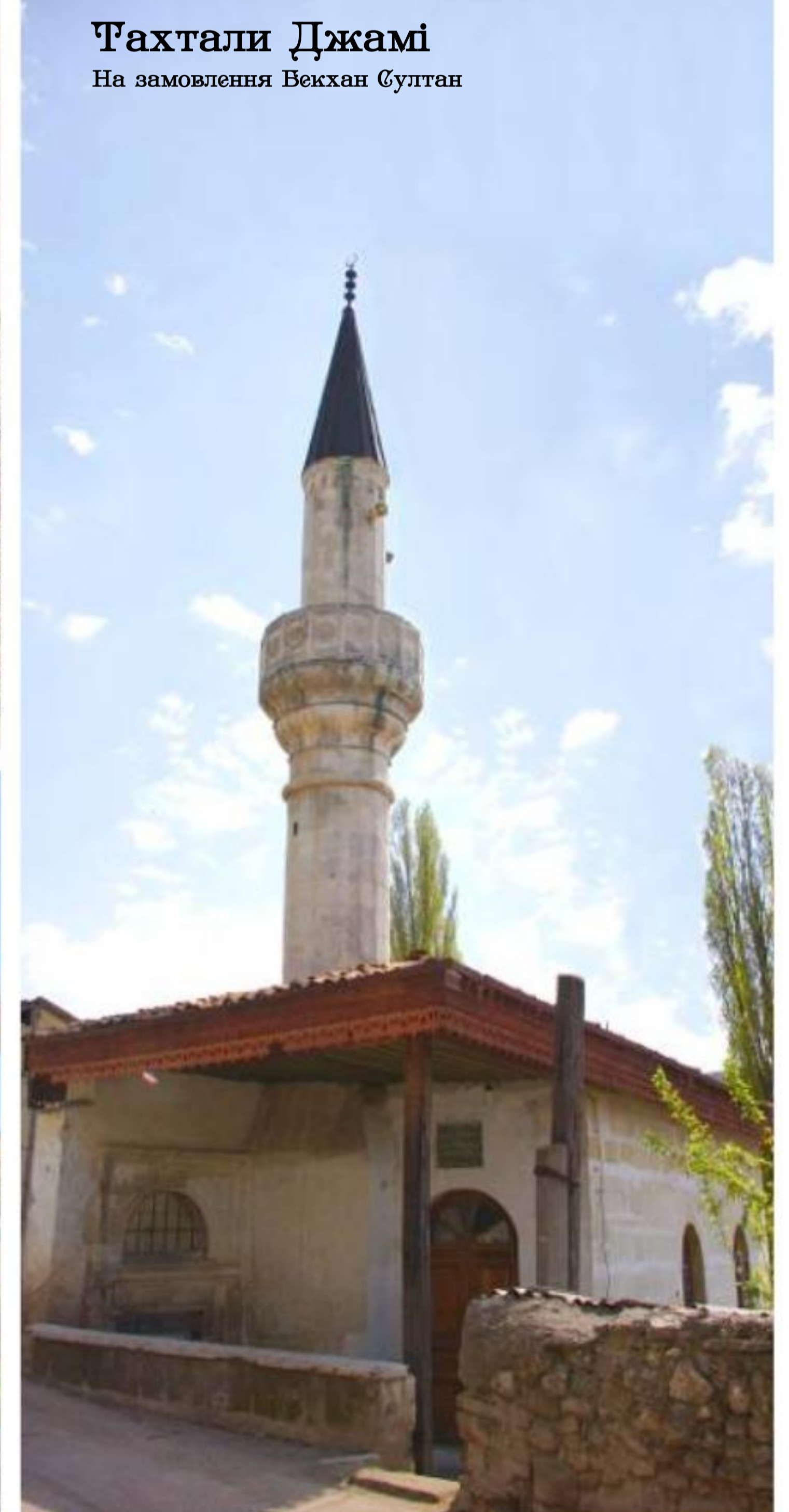
Тахталі Дžамі На замовлення Бекхан Султан