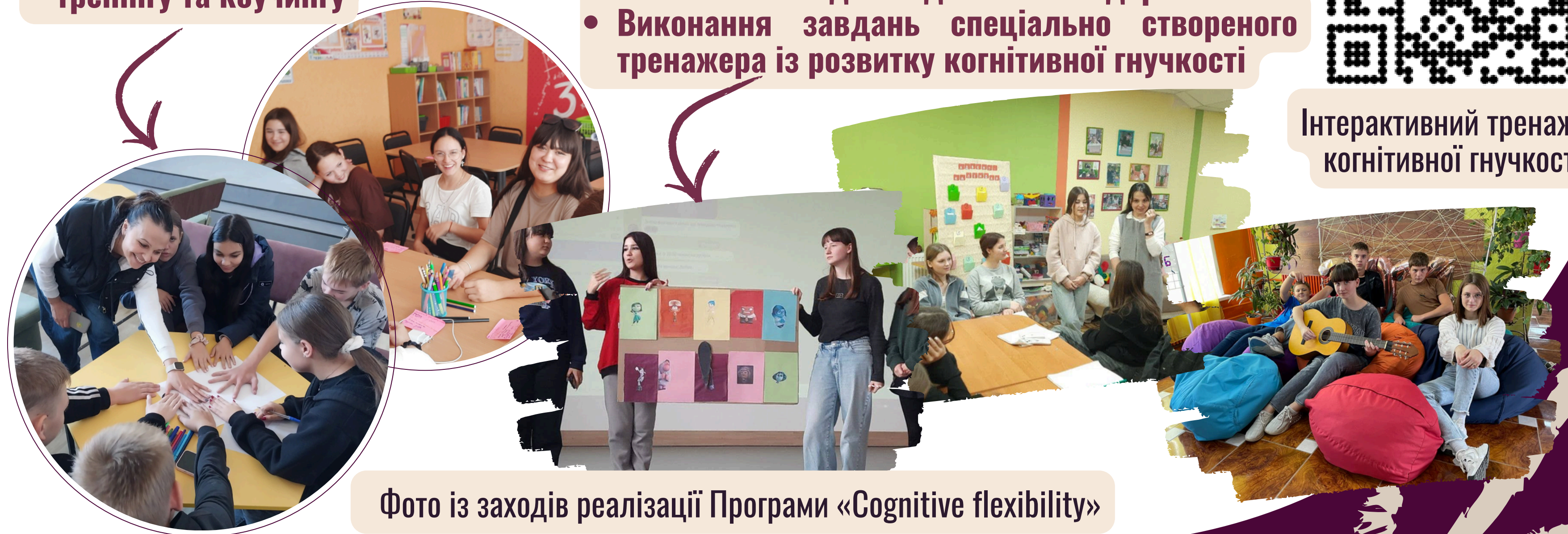
Фото із заходів реалізації Програми «Cognitive flexibility»