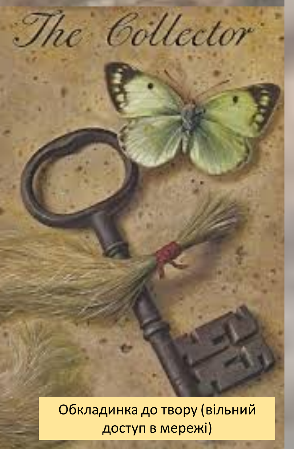
Обкладинка до твору (вільний доступ в мережі)

Мета роботи – розглянути наративні стратегії в романі Джона Фаулза «Колекціонер», з'ясувати функції точки зору на різних рівнях тексту та встановити її роль у створенні своєрідної алегоричної розповіді про зіткнення двох світоглядних систем