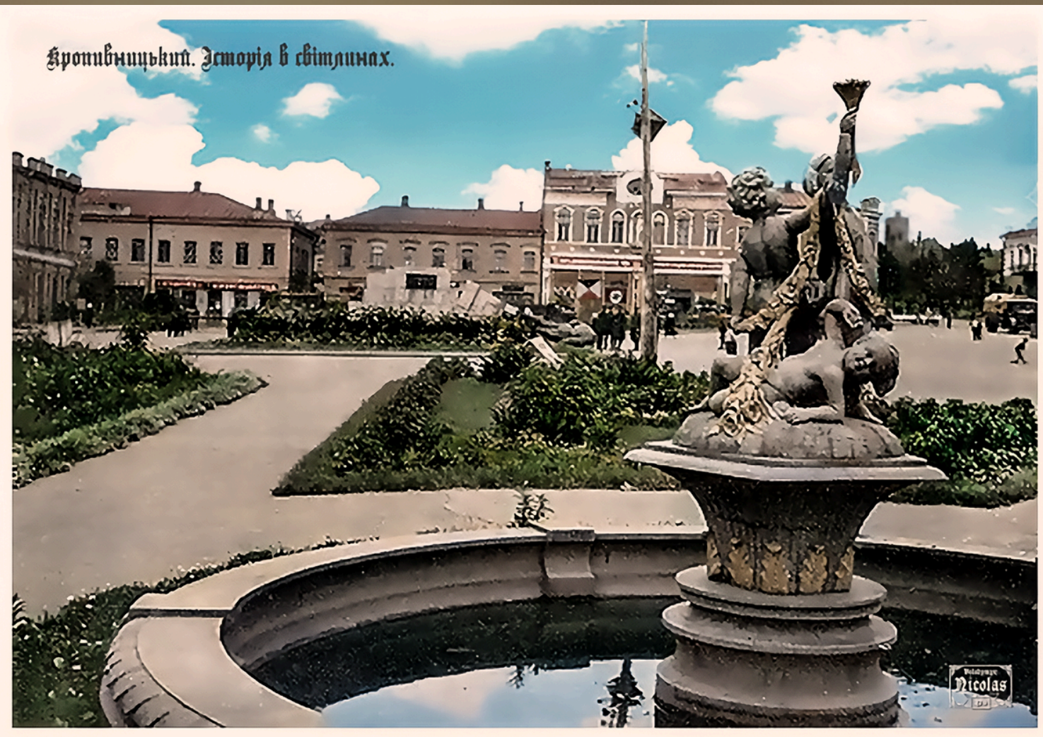
Єлисаветград, кін. ХІХ ст – поч. ХХ ст. Міський бульвар [ https://salo.li/OEV3B2b ]