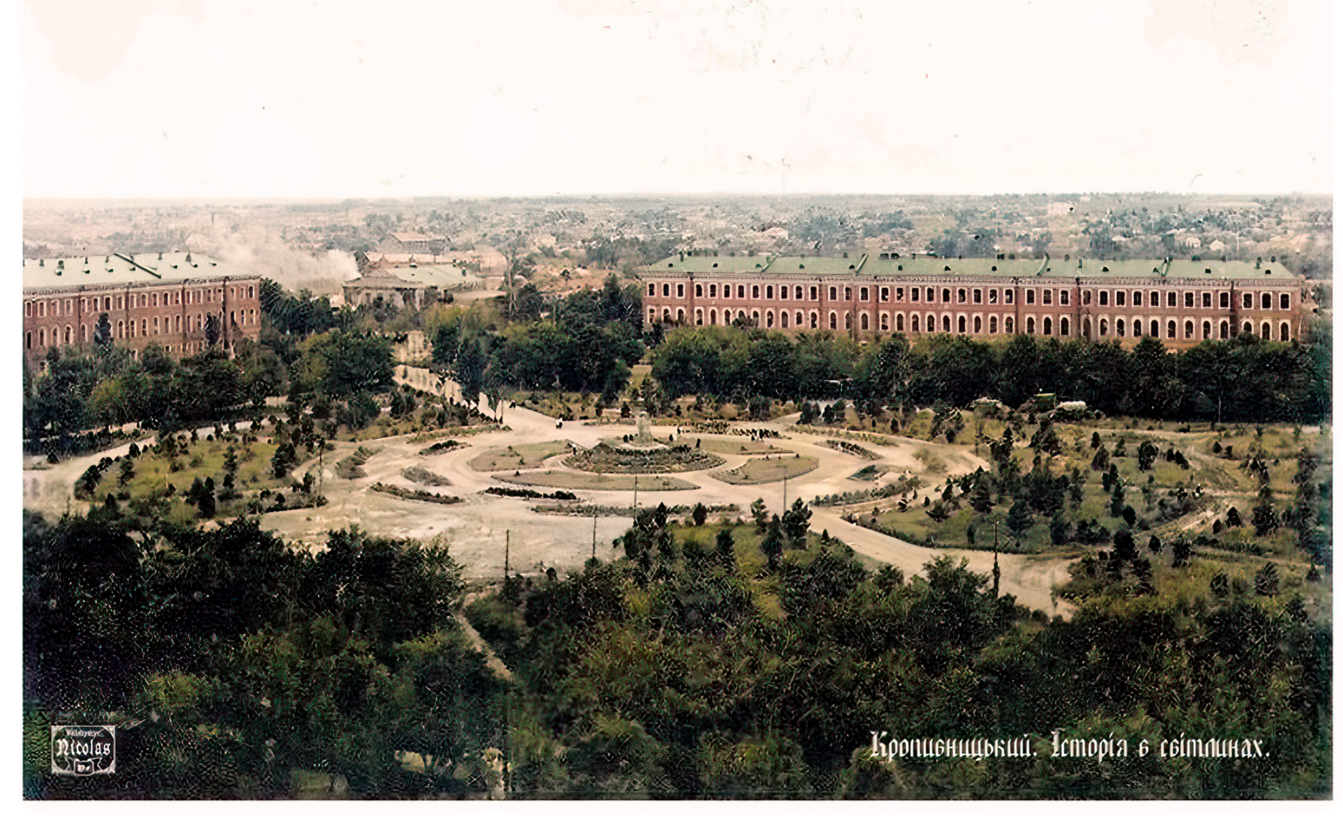
1941 р. Ансамбль військового містечка. [ https://salo.li/Dc86867 ]