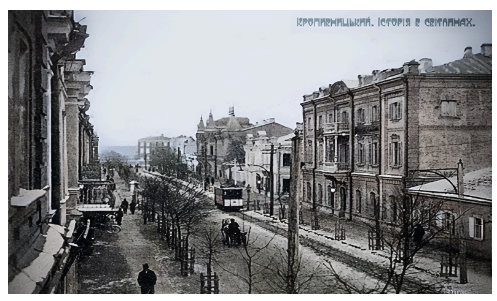
Єлисаветград, вул. Дворцова (Театральна). [ https://salo.li/EOd022B ]